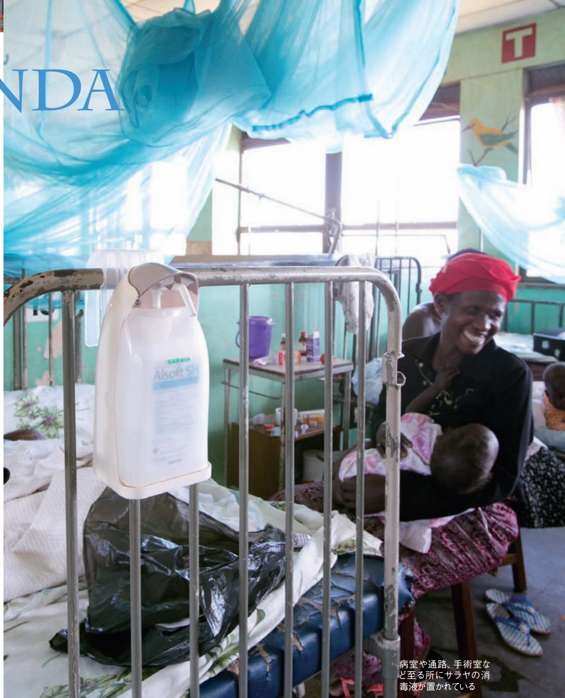
病室や通路、手術室など至る所にサラヤの消毒液が置かれている

自社製品を病院に置いてもらうフィールドテストなどを経て、ウガンダでの消毒液販売事業の準備を始めた。慈善事業ではなく営利事業として取り組むことにしたのは、その方が持続可能になるはずだという考えがあったからだ。ウガンダの人口は現在