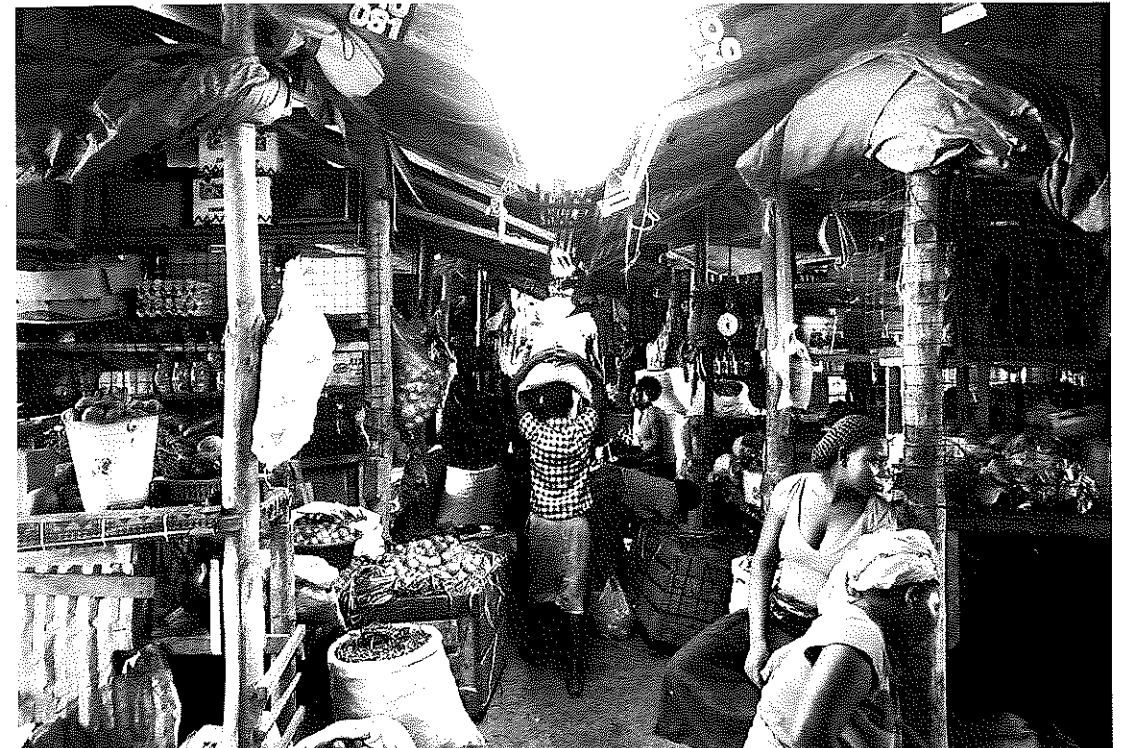
ジュバの胃袋を支えるコニョ・コニョ・マーケット

「アフリカ最長の内戦」と言われたスーダン内戦は2005年の包括和平合意(CPA)の締結をもって終結しました。6年の暫定期間を経て実施された住民投票の結果、南部スーダンが2011年7月に独立して早2年が経ちます。南部独立後に残された、アビエ地域の帰属問題、国境画定、石油収入の配分と言ったいわゆるCPA懸案事項については、昨年9月27日にAUの仲介によりアジス・アベバ合意が成立し、ようやく解決の