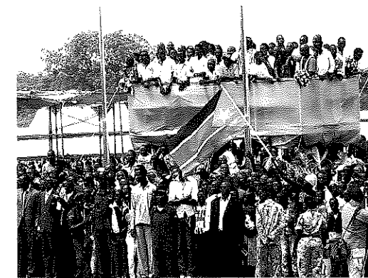
独立記念日で国旗を振る市民

要人往来も活発でした。この一年間でも我が国外務省、防衛省、内閣府からそれぞれ副大臣、政務官の来訪がつづきました。南スーダンから