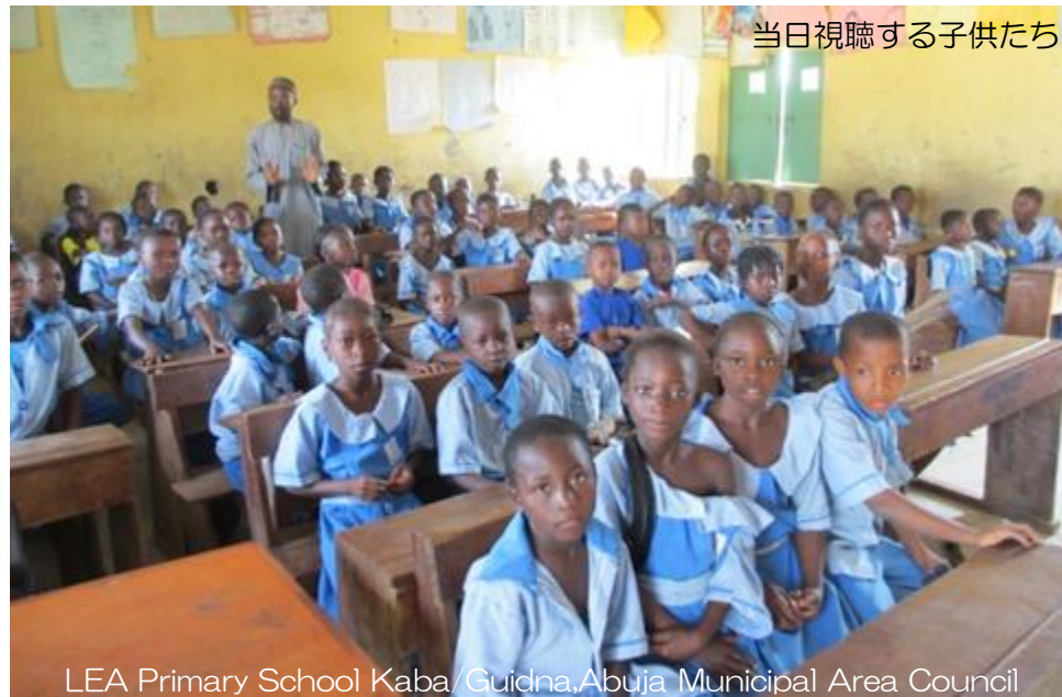
LEA Primary School Kaba/Guidna, Abuja Municipal Area Council