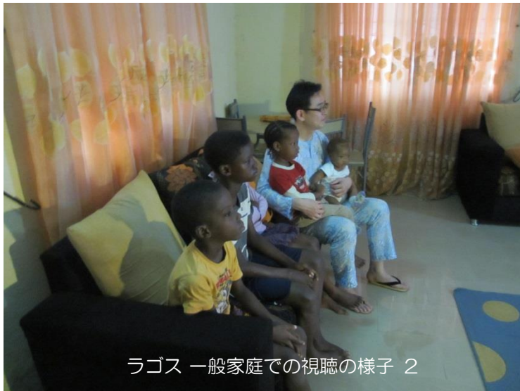
ラゴス 一般家庭での視聴の様子 2