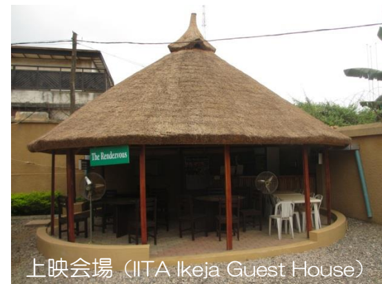
上映会場（IITA Ikeja Guest House）