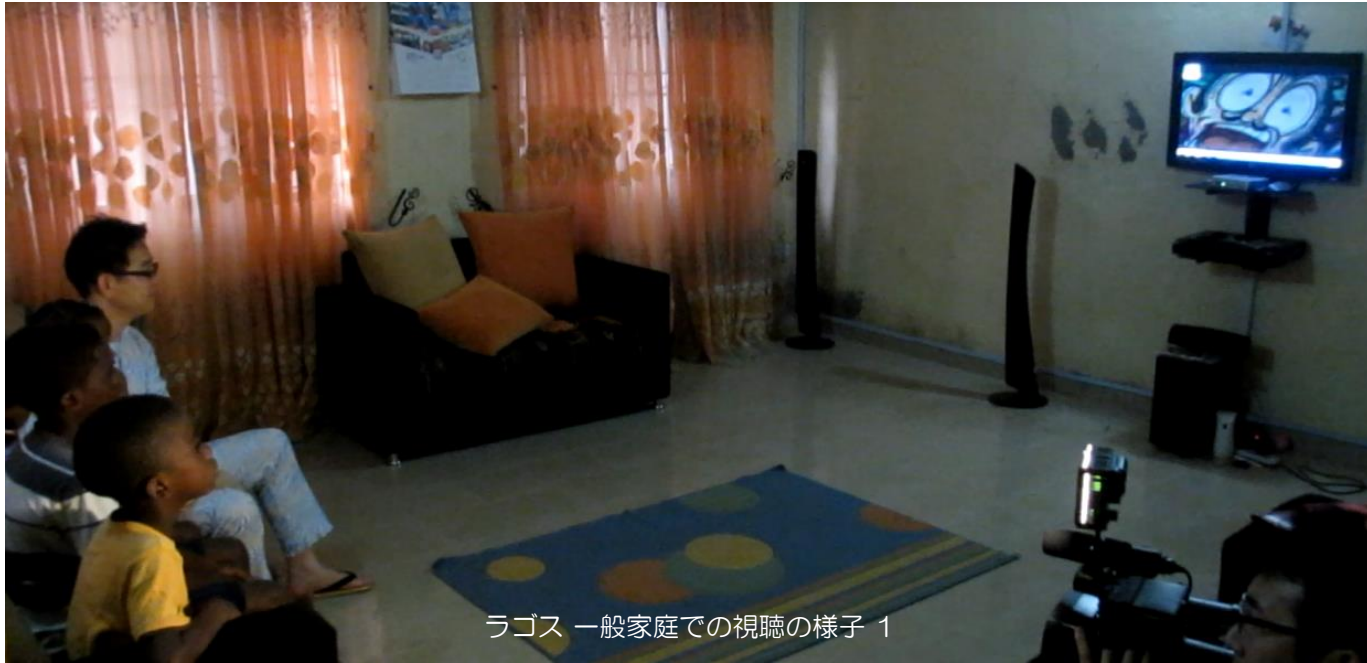
ラゴス 一般家庭での視聴の様子 1