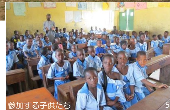
参加する子供たち