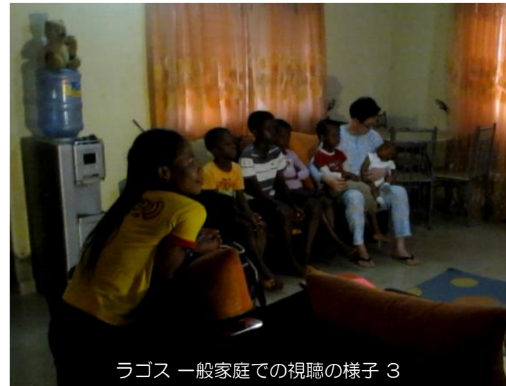
ラゴス 一般家庭での視聴の様子 3