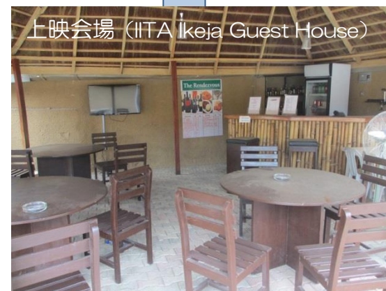
上映会場（IITA Ikeja Guest House）