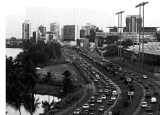
アビジャン市内の様子

豊かな自然と大地に恵まれたコートジボワールですが、1960年にフランスの植民地から独立した後の道のりは、決して平坦なものではありませんでした。独立後の初代フェリックス・ウフェ=ボワニ大統領は、国の基礎は農業にあるとして、豊富な地下資源には取って手をつけず、農業立国を目指して広大なプランテーションを開拓し、コーヒー、カカオを中心とした農産品の輸出により、1970年代には「象牙の奇跡」と呼ばれる高度経済成長を実現しました。しかし、1980年代に入ると一次産品価格の下落により経済が停滞し、1993年に33年に亘る長い統治の後にウフェ=ボワニ大統領が逝去すると、民主化を求める動きが加速化するとともに、国民の蓄積した不満が一気に表面化し、これに農地の土地所有権を巡る問題、部族間の対立等も加わり、90年