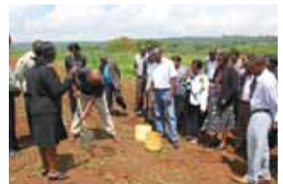
ケニアでの小規模園芸農民組織強化計画プロジェクト(SHEP)の様子

国家レベルでの農業開発計画の策定、農業近代化による生産性改善などとともに、付加価値の高い作物栽培などの市場志向型の農業を導入し、個々の農家の収益向上を図ることが重要です。