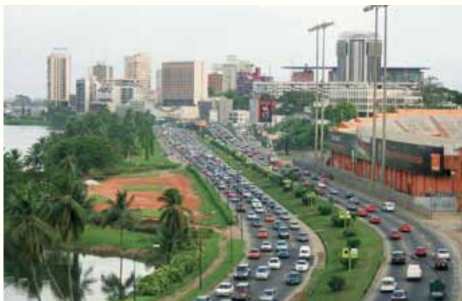
アビジャン市内の主な交通手段や通勤時の混雑状況

コートジボワールの平和・復興は、西アフリカ全体の平和と安定にとって極めて重要であり、今後も支援を加速していく方針です。