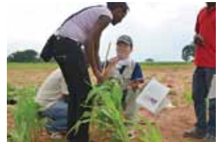
モザンビーク・ナカラ回廊のインフラとその周辺地域を含む総合的開発

アフリカは、広大な大地を抱える一方で農業生産性が長年停滞しており、人口増加に伴う食糧需要の増加を賄うことができず、日本に匹敵する食糧輸入を行っています ※9 。その一方、農業開発の余地が大きく域内の食糧需要も旺盛なことから、アフリカの農業開発が国際的にも有望視されています。今後の開発推進のためには、