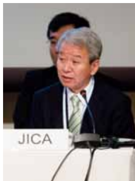
TICADIV AfDB主催の分科会にて発言する理事長

この間、アフリカは2008年秋のリーマンショックによる経済成長の減速、2011年以降の「アラブの春」による政治的混乱、2011年のコートジボワール内乱、2012年以降のマリ情勢の混乱などあったものの、日本を含む先進国がリーマンショック後の成長回復に手間取っているのとは対照的に、2010年以降は5%を超える成長軌道に服しています。