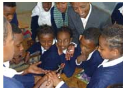
生徒中心型の授業風景