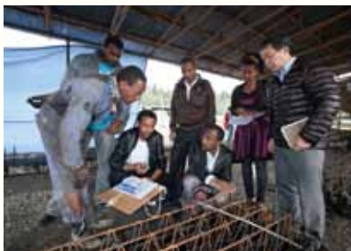
カイゼントレーニングの様子

プロジェクトでは、モデル地区の初等科7-8学年(日本の中学校に相当)の理数科教員に対する、長期専門家(研修運営管理、理数科教育)および短期専門家の派遣や教育関係機関担当者のインドネシアや日本での研修などを通じて、生徒中心型の授業のレベルアップに向けた支援を行っています。