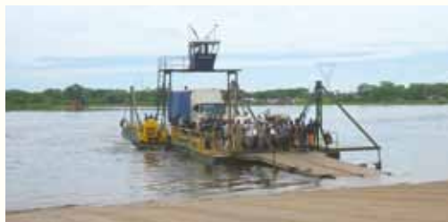
重量トラックを運ぶフェリーの様子