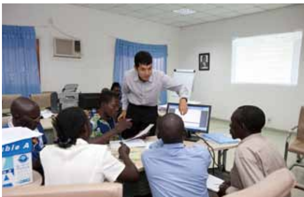
南スーダンでの理数科教育強化(SMASE)の様子

より広範に展開するとともに、新たなアフリカの地場産業と現地日本企業のニーズに即した人材育成支援を行っていきます。