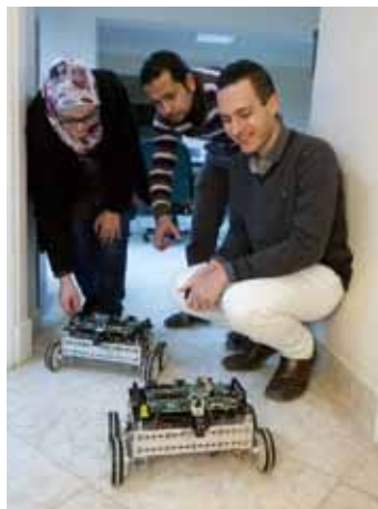
エジプトでの理工系大学の教育支援(E-JUST)

今後は、「アフリカ支援パッケージ」における人材育成関連のコミットメント(産業人材3万人育成、TICAD産業人材育成センター10カ所設立など)を踏まえ、これらの人材開発支援を